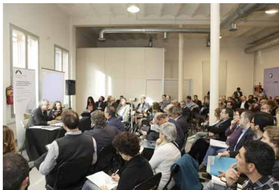
UNA ASSEMBLEA DE LA FEDERACIÓ DE COOPERATIVES DE TREBALL DE CATALUNYA

La Federació de Cooperatives de Treball de Catalunya, ubicada al carrer de Premià de Barcelona, en un edifici amb tradició cooperativista, té el doble objectiu de fer créixer i consolidar les iniciatives existents, i afavorir la creació de nous projectes. Els programes de finançament i de formació són les dues grans potes de la seva estratègia, però també